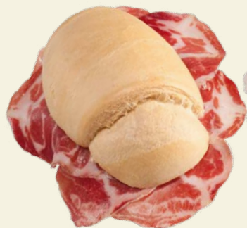
Coppa Piacentina DOP