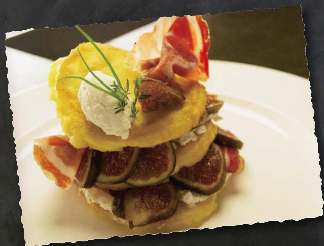
Burtleina con Coppa piacentina DOP, fichi e ricotta salata

Tagliateli, scolateli dall'unto e disponeteli su un foglio di carta assorbente.