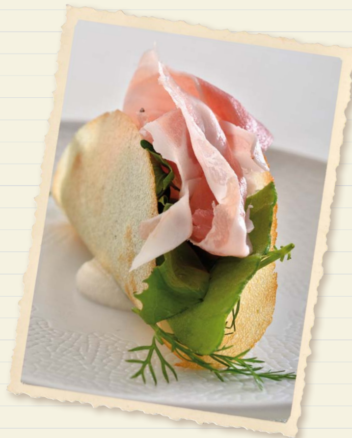
Tacos con Pancetta piacentina DOP