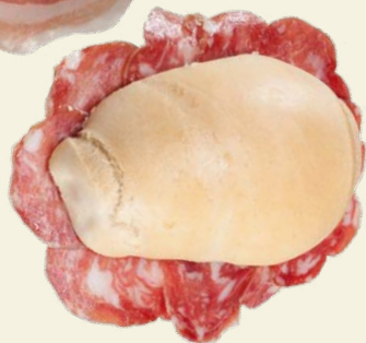
Salame Piacentino DOP