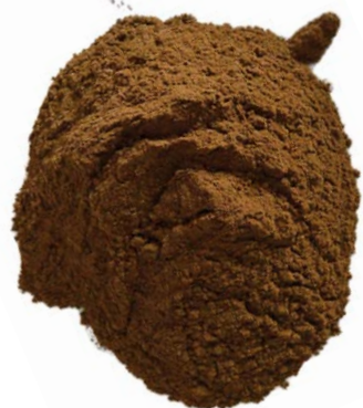
Chiodi di garofano