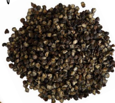
Pepe nero e pepe bianco