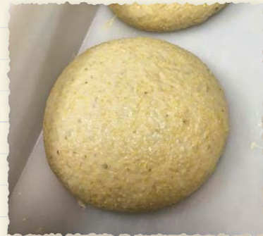
Panetto di Batarò